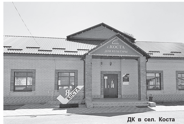
ДК в сел. Коста

15. Капитальный ремонт Дома культуры (2021 г.)