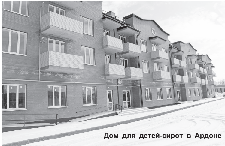
Дом для детей-сирот в Ардоне

9. Установка металлических ограждений и пешеходных переходов возле школы и детского сада (2020 г.)